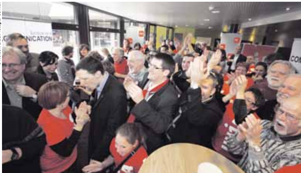
Freude am Abstimmungssonntag: Fast drei Viertel der Stimmberechtigten haben Nein gesagt.