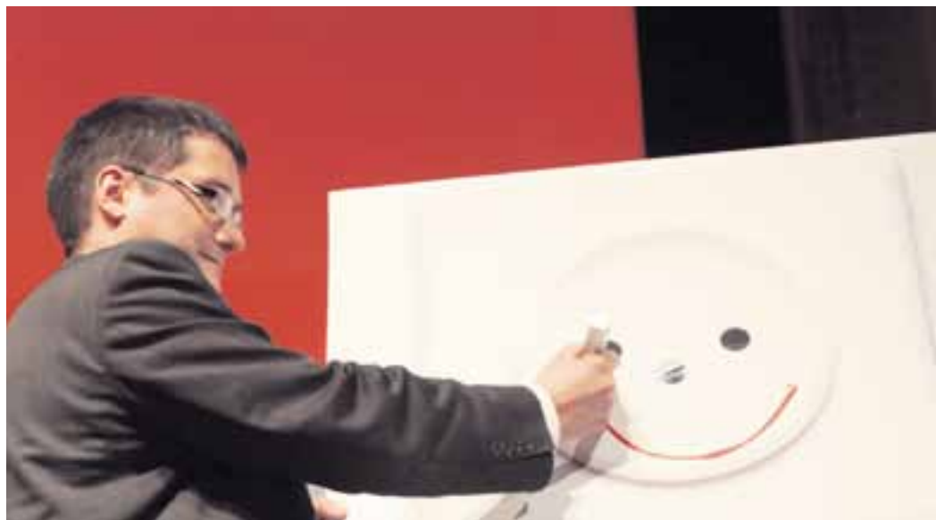
Christian Levrat an der Delegiertenversammlung: Symbolische Lancierung der Cleantech-Initiative.