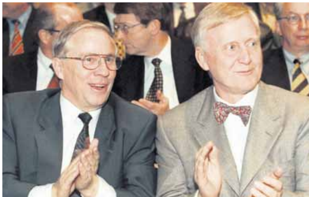
Haben die Abzocker-Seuche in die Schweiz eingeschleppt: Christoph Blocher und Martin Ebner.

Blocher gelang es, Minders Vertrauen zu gewinnen. Gemeinsam präsentierten sie eine «Einigungslösung». Als ob eine Einigung zwischen Minder und Blocher ein tragfähiger politischer Kompromiss und für das Parlament eine bindende Verpflichtung wäre. Der SVP dieses Projekt anzuvertrauen wäre fatal gewesen: Die ursprünglichen Anliegen des Initianten drohten zum Unkenntlichen verwässert zu werden, nachdem Blocher und Minder plötzlich auf den Rückzug der Initiative setzten.